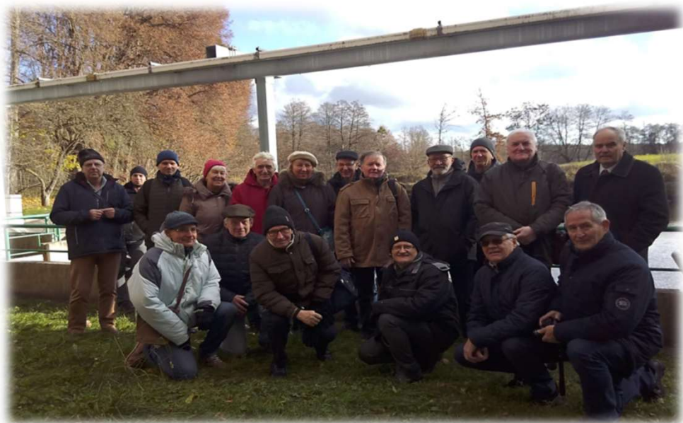
Elektrownia w Gródku.

Zwiedzanie elektrowni wodnych w miejscowości Żur i Gródek, wybudowane w okresie międzywojennym, jako zasilanie dla budowanego portu morskiego w Gdyni.