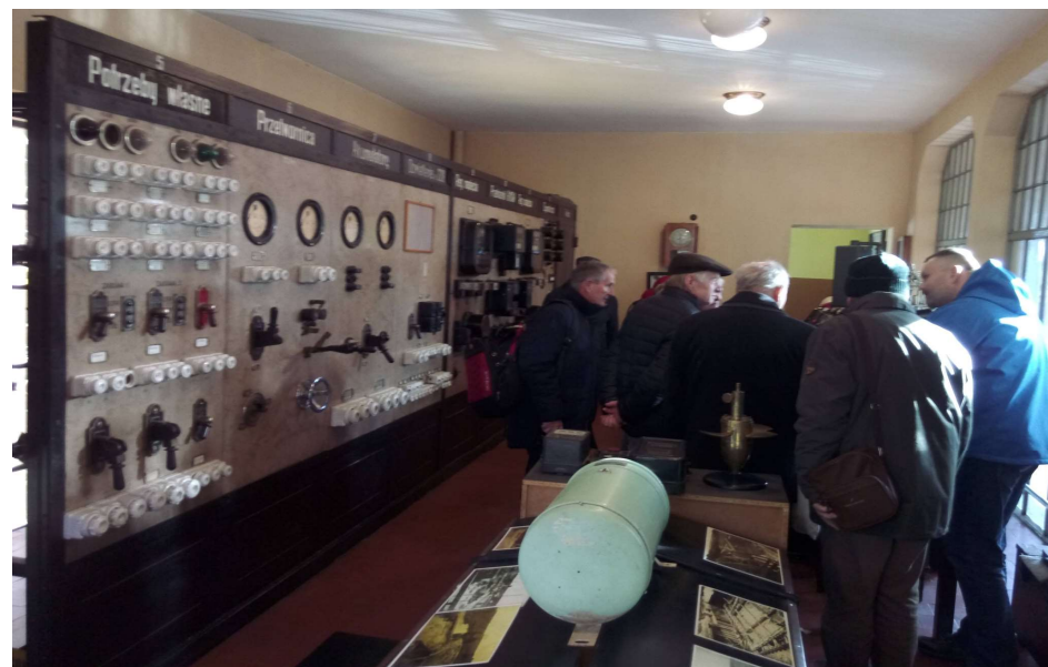
Stara tablica rozdzielcza w muzeum.