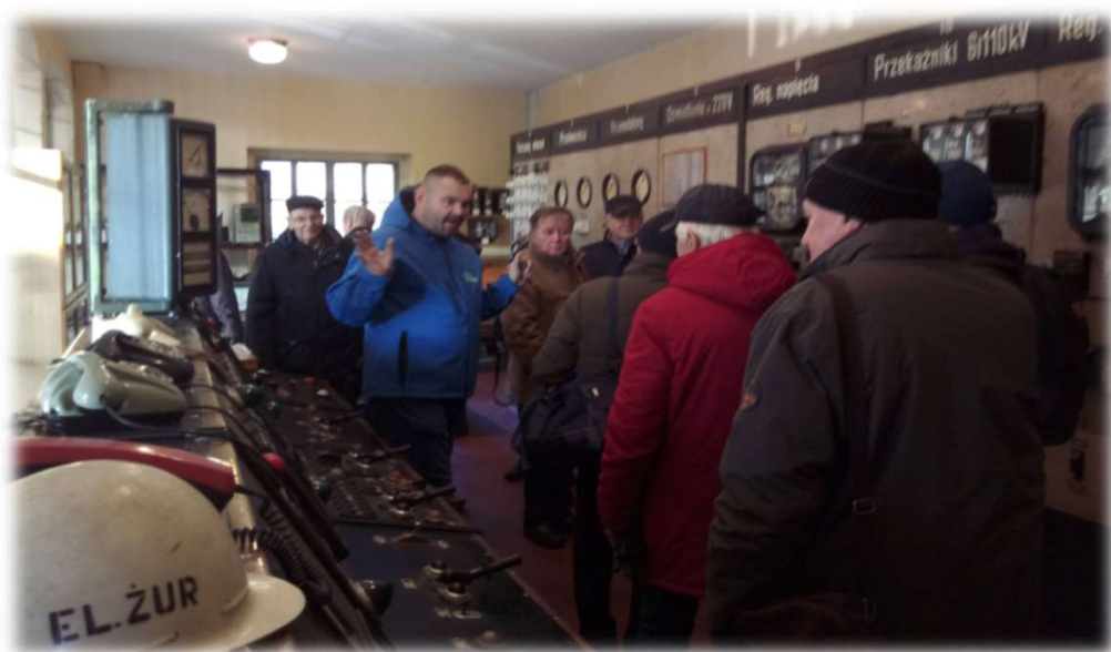
Muzeum starej elektrowni w Żurze.

Zwiedzanie elektrowni wodnych w miejscowości Żur i Gródek, wybudowane w okresie międzywojennym, jako zasilanie dla budowanego portu morskiego w Gdyni.