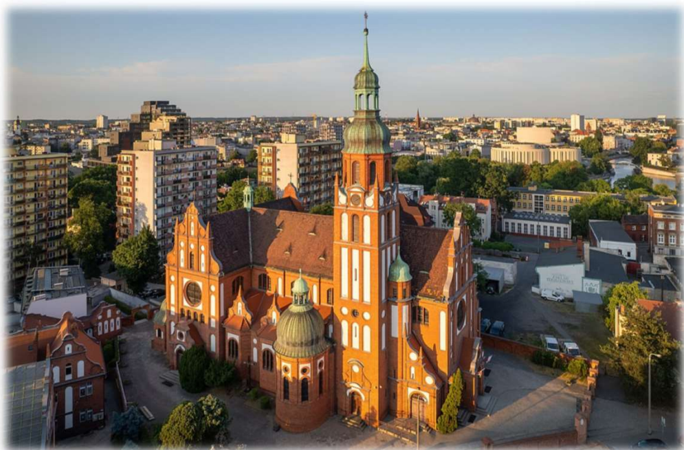
Kościół św. Trójcy w Bydgoszczy