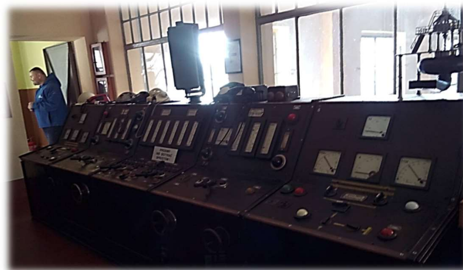
Stary pulpit sterowania