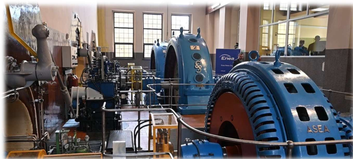
Muzeum w Gródku.