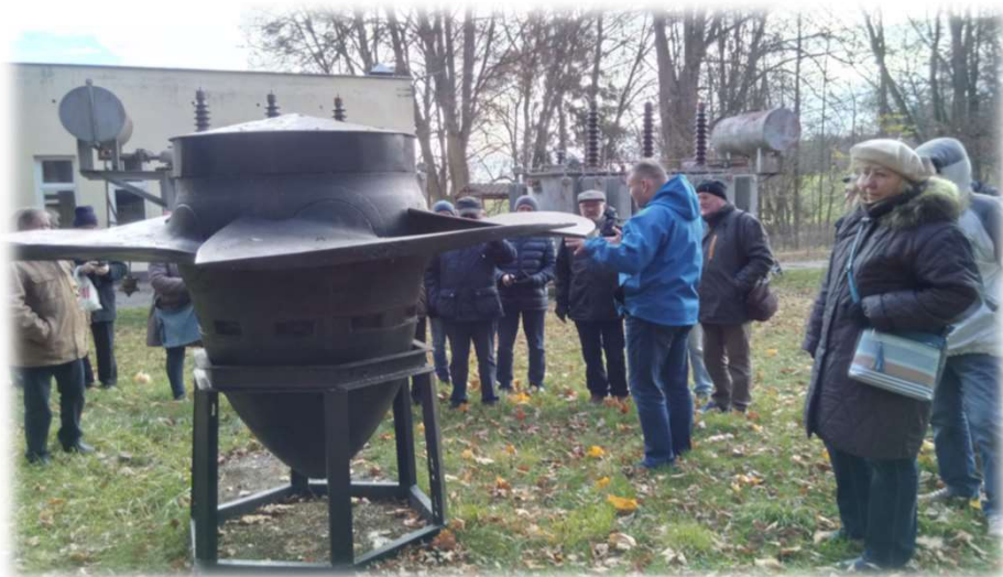
Turbina wodna Kaplana.

Zwiedzanie elektrowni wodnych w miejscowości Żur i Gródek, wybudowane w okresie międzywojennym, jako zasilanie dla budowanego portu morskiego w Gdyni.